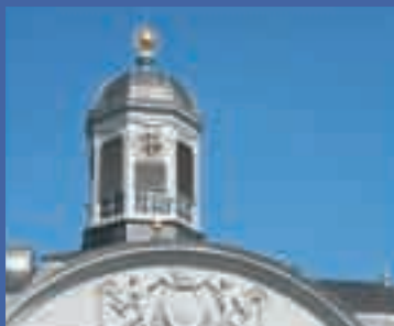
Photo de couverture : Detail de l'Hôtel de Ville