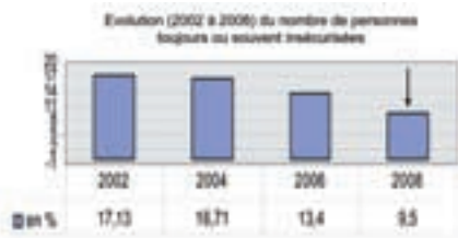
Le sentiment d'insécurité au sein de la Zone Vesdre

Le verviétois se sent de plus en plus en sécurité. Et c'est lui qui le dit ! Plusieurs centaines de personnes, de Verviers mais aussi des deux autres communes de la Zone Vesdre, ont été interrogées afin de dresser le « Moniteur de sécurité 2008-2009 ».