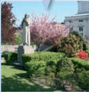
En couverture : Square Astrid derrière le Grand-Théâtre