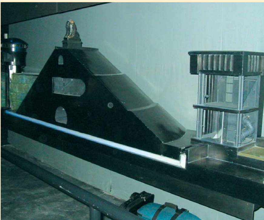
«La reconstitution du barrage de la Gileppe»

La nouvelle Maison de l'Eau a été officiellement inaugurée le 5 octobre dernier dans l'immeuble Pierre de Bonvoisin sur les berges de la Vesdre, au 86 de la rue Jules Cerexhe. Cette nouvelle attraction est un complément idéal au Centre Touristique de la Laine et de la Mode situé à deux pas, rue de la Chapelle.