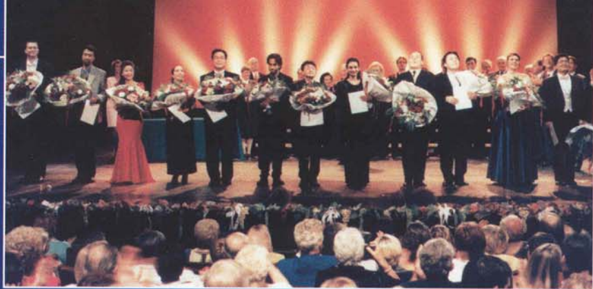
Les finalistes de la précédente édition en 1999.