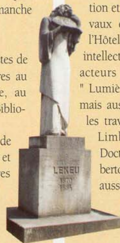
Le monument Guillaume LEKEU

● Concert de Rytm'n blues dans le Parc de l'Harmonie : construit en 1852, le kiosque accueillera un concert du groupe Limited Edition dimanche à 17h. Rens. : 087/ 23 49 10