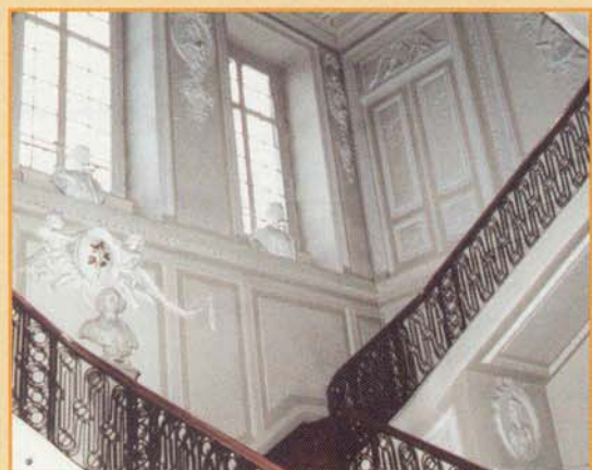
Les escaliers intérieurs de l'Hôtel de Ville

Ouverture : samedi, dimanche et lundi de 10h à 18h. Rens. : CTLM : 087/35 57 03.