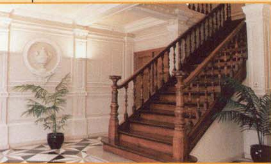
Le Centre Touristique de la Laine et de la Mode, entrée principale

Verviers ne sera évidemment pas en reste avec plusieurs rendez-vous sur le thème 2001 : " itinéraires au fil des idées ". Une invitation à visiter des monuments et sites liés à la mémoire, au savoir, au pouvoir, à la culture, aux cultes. Voici l'agenda verviétois :