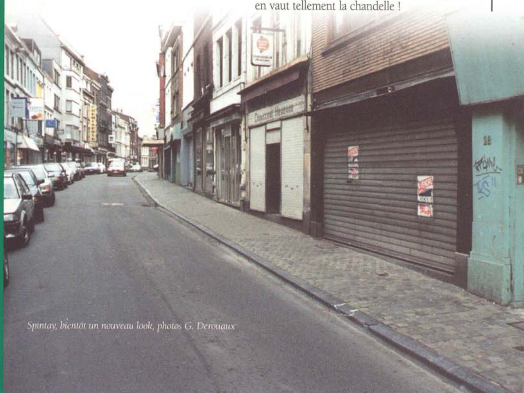
Spintay, bientôt un nouveau look