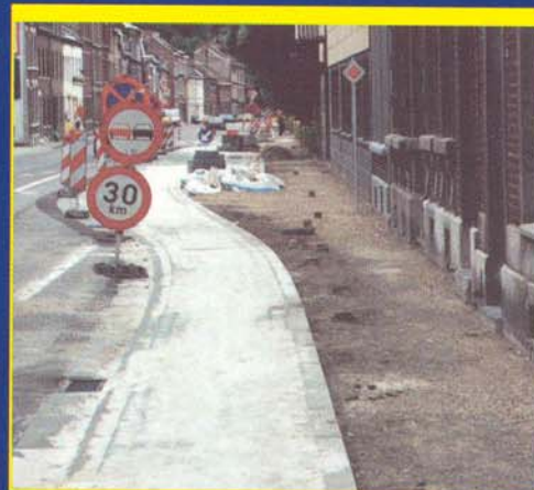
Les premières rue de Pepinster, photo G. Derouaux

Vu l'étroitesse des voiries communales, les aménagements cyclables se limiteraient souvent au marquage de bandes cyclables telles une bande de couleur sur le côté