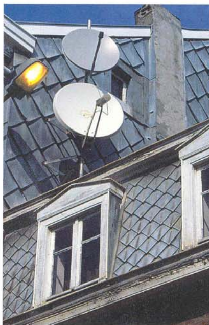
Pas de taxe en 1999 sur les antennes paraboliques.

Voici quatre ans, la Ville de Verviers avait choisi de lever une taxe sur les antennes paraboliques extérieures de télévision. S'il ne convient pas d'exclure la motivation financière et le nécessaire besoin de maintenir l'équilibre budgétaire dans une commune dont la situation reste préoccupante, il ne faut pas non plus négliger le besoin de maintenir un équilibre architectural au sein de notre entité. Ces dernières années, Verviers a consenti de très gros efforts dans le souci de restituer un espace de vie convivial à sa population. Les travaux en cours aujourd'hui attestent à suffisance de ce souci. Or, ne pas établir une mesure de dissuasion à l'installation d'antennes parabo-