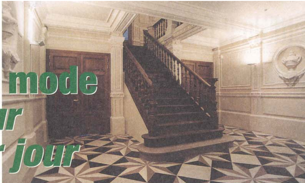
L'entrée de la maison de maître qui accueille les salles de séminaire du CTLM. Impressionnante.

Verviersima. Comprenez "le meilleur de Verviers". Le terme, retenu comme nom commercial du Centre Touristique de la Laine et de la Mode, en dit long sur les espoirs placés en lui. En parallèle à la rénovation urbaine, Verviersima contribuera à transformer notre ville en nouveau centre d'attraction touristique. Dès fin avril prochain.