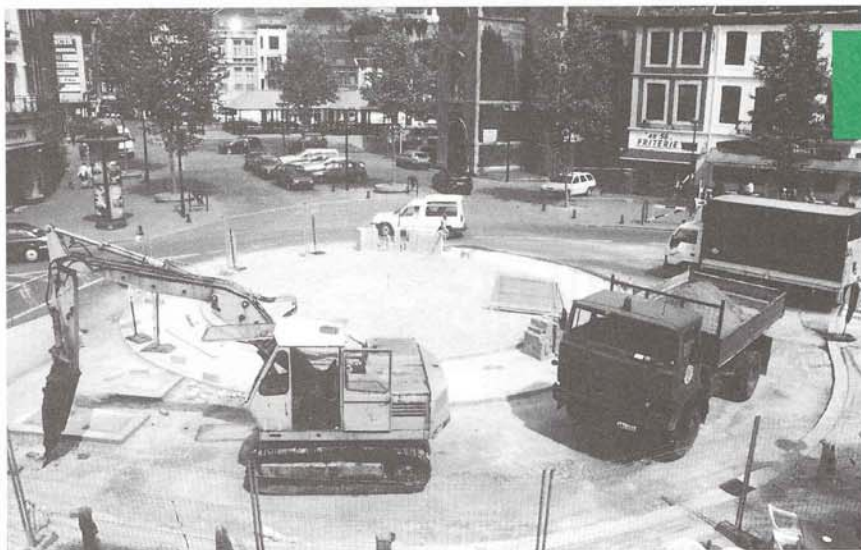
Le centre-ville en chantier, pour son bien.

Il était sur toutes les lèvres depuis des mois. Aujourd'hui, il se met en place. Le nouveau plan de circulation, de stationnement et de régulation de trafic sera opérationnel d'ici la fin de l'année prochaine. Le point sur les chantiers et le programme des travaux à venir.