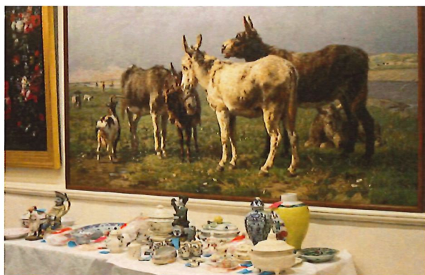
Werkelijk overal waren keramische museumstukken te zien. Ook voor dit schilderij.