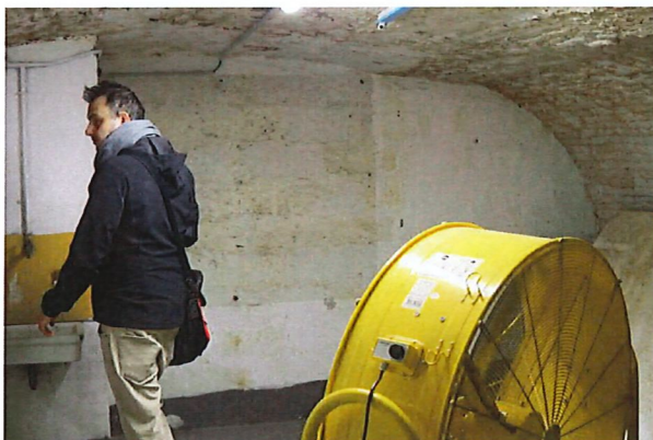
De ondergelopen museumkelders werden gesaneerd. Ze staan nu nog te drogen met industriële ventilatoren en ontvochtigers, zoals hier in het Museum voor Archeologie en Folklore.

Tijdens het bezoek keken de journalisten met grote ogen naar alle stukken die werkelijk overal lagen: op de vloer, op de rekken en op kasten. Dat zal nog zo een tijd blijven. Er is nog heel veel werk.