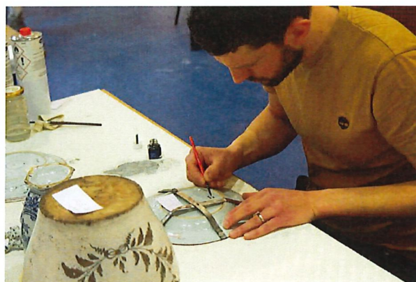
Het inventarisnummer wordt opnieuw aangebracht.

De inventarisnummers waren afgewassen of niet meer leesbaar na het reinigen van de keramische objecten uit het Vervierse Museum voor Schone Kunsten en Keramiek. Met Chinese inkt brengt een medewerker de nummers opnieuw aan op elk museumstuk.