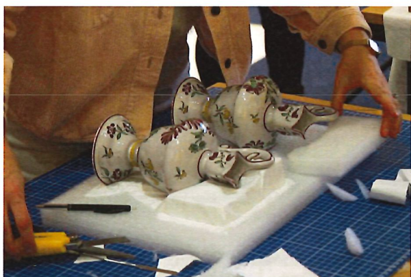
Voorzichtig pakt een medewerkster het keramiek in. De Vervierse museummedewerkers konden ook rekenen op de solidariteit van het Museum M uit Leuven, van de Universiteit Antwerpen en tal van andere vrijwilligers. Door hun steun worden nu verschillende werken gerestaureerd, zoals het negentiende-eeuwse poppenspel Bethlehem van Verviers en een twintigtal keramische stukken.