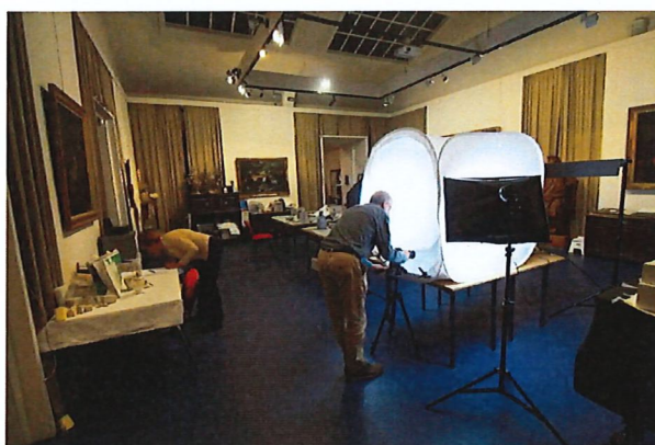
Een andere medewerker fotografeert elk museumobject.