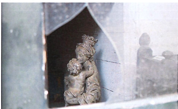
Experten van het KIK voeren de studie en de behandeling uit van de Zegenende God de Vader en de Madonna met Kind, twee polychrome houten beeldjes (ca 1500). Mijn foto van een beeld door een gebroken ruit van een bijgebouw van het archeologie- en folkloremuseum.

Lees ook het eerste stripalbum van Swoi de serrist: het is nog altijd te koop in de krantenwinkel Alex in Duisburg en bij het feestcomité van Duisburg.