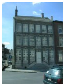
la maison Vivroux (n° 17)