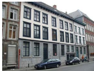
l'ancien Hôtel Franquinet (n° 44 à 48)