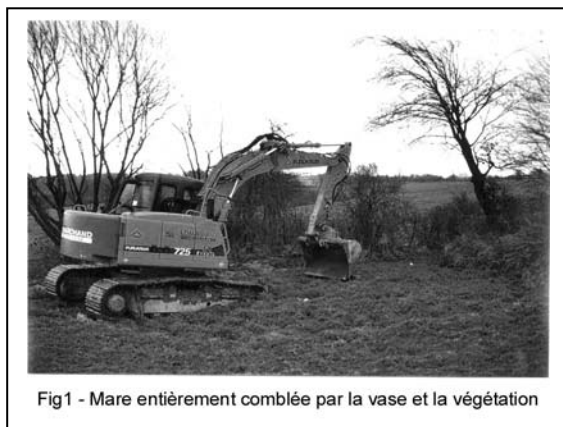
Fig1 - Mare entièrement comblée par la vase et la végétation

Les mares agricoles ne sont plus que rarement utilisées pour l'abreuvement du bétail. Elles ne sont plus entretenues, elles sont envahies par la végétation et finissent entièrement envasées (Fig. 1).